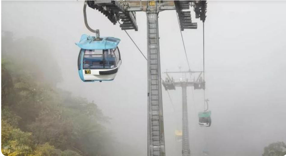
世界最快的单轨缆车