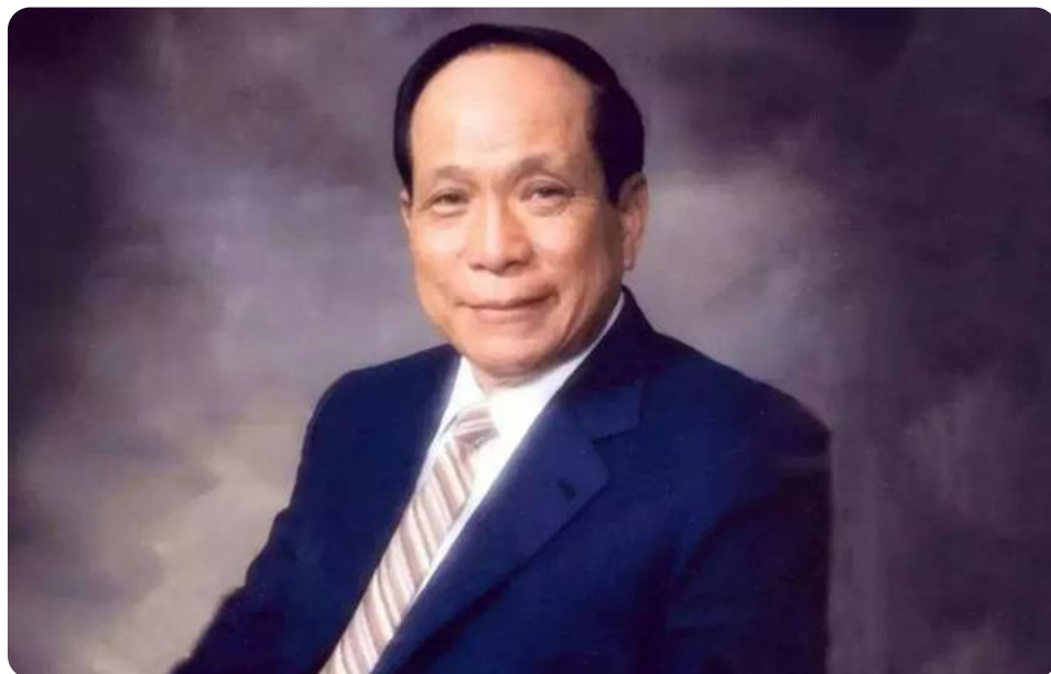
图|已故大马赌王丹斯里林梧桐